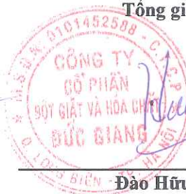
Đào Hữu Huyền