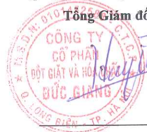
Đào Hữu Huyền